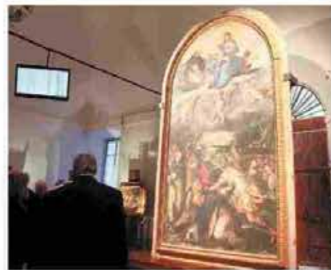
Il Museo Vasariano di Santa Croce a Bosco Marengo

Durante l'evento di fine settembre (è in programma il 25 e il 26), gli esperti di 3D ArcheoLab riprodurranno un'opera del Vasari con una stampante a tre dimensioni: «L'oggetto - spiega Robutti - sarà identico alla statua o alla struttura, con la differenza sostanziale che potrà essere toccato, senza paura di rovinarlo. In questo modo anche i non vedenti potranno capire